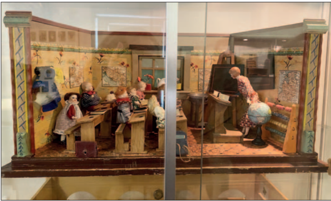
Abbildung : Puppenschule, um 1925. Die Puppen aus Biskuitporzellan deuten darauf hin, daß dieses Spielzeug für ein Kind aus einer wohlhabenden Familie gedacht war. Die kleinen Hefte konnte man im Spielwarenladen kaufen. Die Einrichtung orientiert sich an den realen Gegebenheiten der Zeit. Schule-Spielen war vor einigen Jahrzehnten noch ein häufig zu beobachtendes Kinderspiel. Für jüngere Kinder bot es oft den ersten spielerischen Kontakt mit den Ritualen der Schule; schulpflichtigen Kindern half es, Erlebnisse und Konflikte, die mit der Schule in Zusammenhang standen, spielerisch zu verarbeiten.

viele Kinder nur eine ABC-Tafel, ein Holzbrettchen mit aufgemaltem Alphabet in Groß- und Kleinbuchstaben, einigen Silben und einem geistlichen Text, meist dem „Vaterunser“. Danach las man im Katechismus. Erst ab dem 18. Jahrhundert entstanden die Vorläufer unserer Fibeln, ABC-Bücher und „Namenbüchlein“, auch Lesebücher mit kurzen kindgemäßen Texten wurden in dieser Zeit gedruckt. Quellen belegen, daß seit der Antike über Hilfsmittel nachgedacht wurde, mit denen man die Schüler zum Lesen motivieren oder das Lesenlernen erleichtern wollte. Der Pädagoge Jan Amos Comenius kombinierte in seinem Schulbuch „Orbis pictus“ die Buchstaben mit Bildern als Assoziationshilfe; die „Lesemaschine“, auch „Setzkasten“ genannt, hielt Einzug in die Klassenräume der Schulanfänger. Im 20. Jahrhundert hat sich das Angebot an Lernhilfen für den Leseunterricht um viele Varianten erweitert.