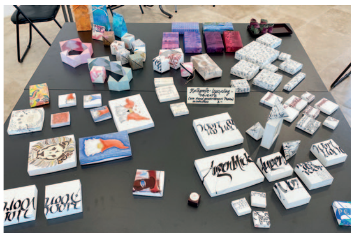
Edle Papierschachteln aus kalligraphiertem Papier in allen Größen. Tüten, Klappschachteln und weitere Papierobjekte wurden gegen eine Spendensumme zum Verkauf angeboten.