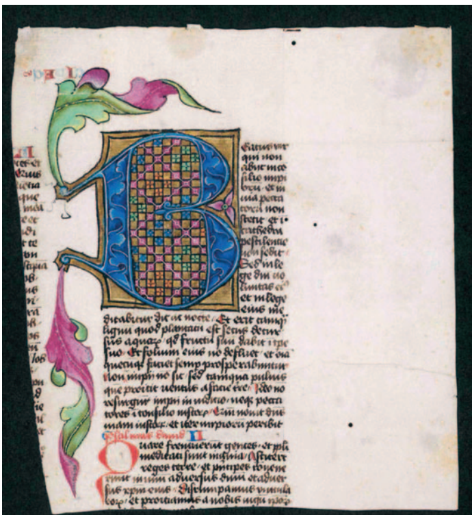
Psalm „Beatus vir qui non abiit in consilio impiorum...“ (Wohl dem, der nicht wandelt im Rat der Gottlosen). Initiale B, die aus der Bibelhandschrift ausgeschnitten wurde. (Gutenberg-Museum 2022)

Im Rahmen der Umbaumaßnahmen des Gutenberg-Museums in Mainz wurden im Frühsommer 2021 sechs gemalte Initialen aus der Mitte des 15. Jahrhunderts wiedergefunden. Offensichtlich wurden sie aus einer Bibel-Handschrift herausgeschnitten. Wer diesen Frevel beging, ist unbekannt. Jetzt werden die Initialen wieder in das ursprüngliche Buch eingearbeitet. Eine Ausstellung im Gutenberg-Museum zeigt sie zuvor noch.