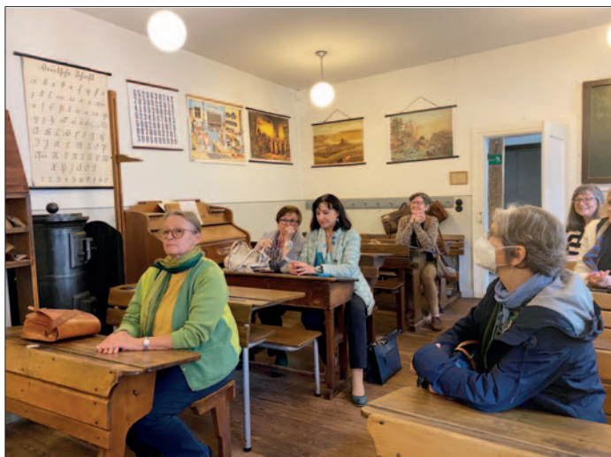
Im historisch eingerichteten Klassenraum aus der Zeit um 1930 fühlte sich die ein oder andere in die eigene Schulzeit zurückversetzt.