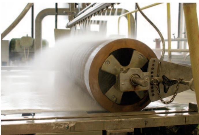
Ganz oben: Ein Geselle in Holzpantinen presst einen großen Stapel nasse Papierbögen, die mit dem Schöpfsieb auf Tücher „gegautscht“ wurden, in einer großen Holzpresse. Darunter: In der modernen Papierherstellung wird Papier in meterlangen Bahnen hergestellt. So entstehen vom Maschinenbütten- bis zum Druckpapier heute fast alle gebräuchlichen Papiere. Oben rechts: Papierdrache

und bei einigen Stichworten kann auch gebastelt, ausprobiert und geforscht werden. Ob Papiercollagen, Falschgeld, DIN-Formate, Steckbriefe oder Papierflieger, für jeden ist etwas zum Entdecken da.