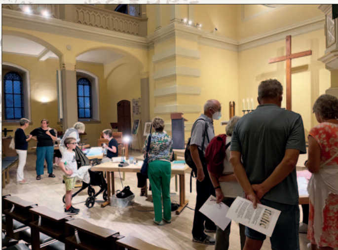
Die Michaelskirche in Eberbach wurde zum Anziehungspunkt von Jung und Alt.