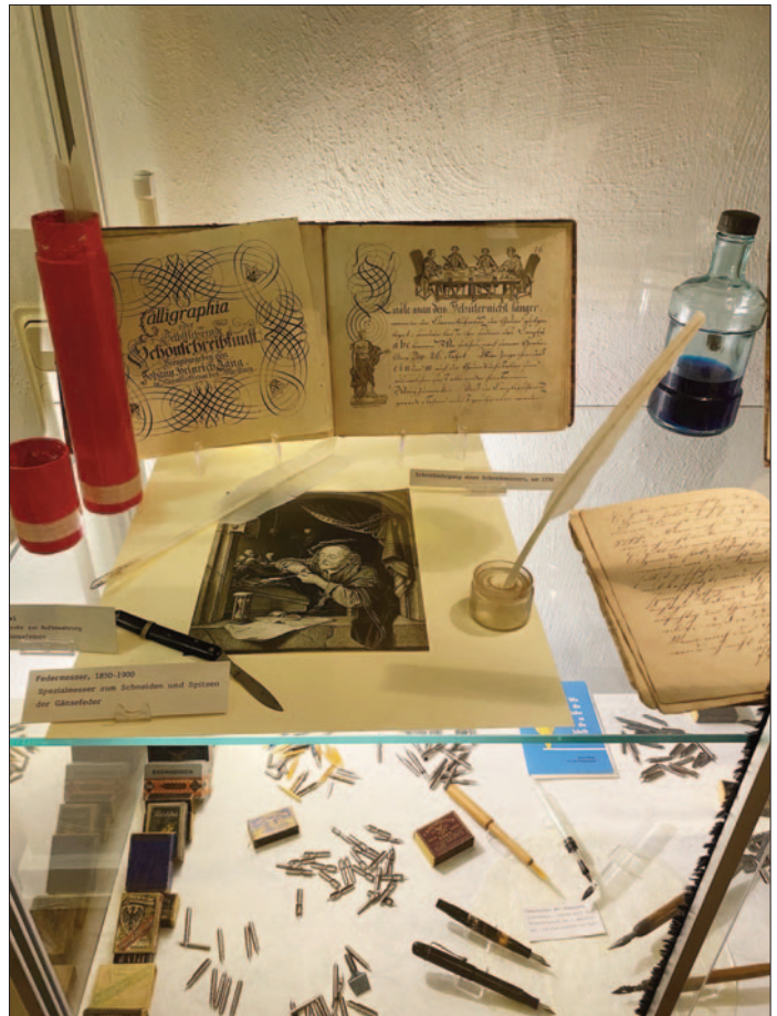
Blick in die Vitrine zum Thema Schreiben und Kalligrafie. Die meisten Utensilien sind uns bestens vertraut! Besonders wertvoll waren die Bücher zum Erlernen der Kalligrafie.

Die Geschichte des Schreibunterrichts ist eng verbunden mit der Entwicklung des Schreibgeräts und der Beschreibstoffe. Aus Ägypten hatten Papyrus und Rohrfeder über die Römer im Abendland Eingang gefunden, doch im Mittelalter wurde dieser Beschreibstoff durch das Pergament, das ebenfalls schon seit der Antike Verwendung fand, bei uns verdrängt. Aus Ziegen-, Schafs- oder Kalbshaut hergestellt, war es sehr teuer, so dass höchstens Reste zu Unterrichtszwecken benutzt wurden. Ab dem 14. Jahrhundert wurde in Deutschland Papier hergestellt; es wurde bald zum vorherrschenden Schriftträger. Auf Pergament und Papier wurde mit Rohrfeder oder Gänsekiel geschrieben. Beide mussten zugeschnitten und immer wieder nachgespitzt werden. Dazu gab es spezielle Federmesser, die zugleich auch als Radiermesser dienten.