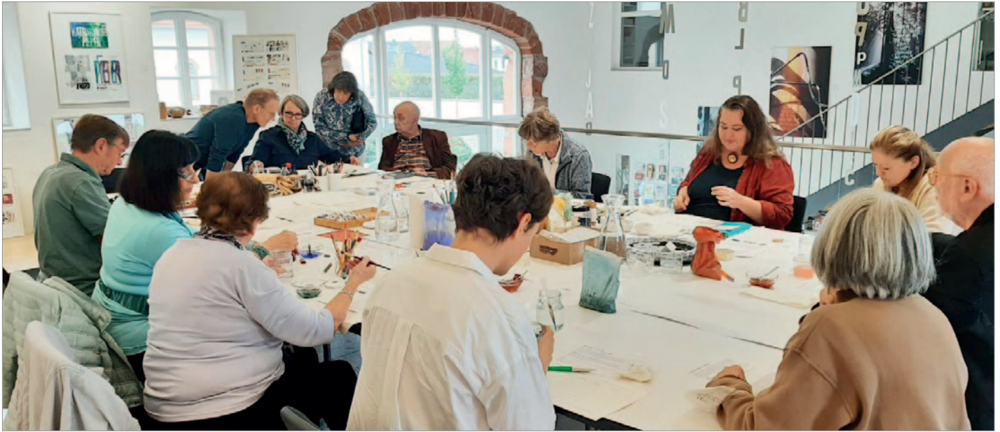
Am großen Tisch waren „säckeweise“ Pigmente wie Ocker aus der Provence oder andere natürliche Farbpigmente aufgestellt, dazu Mörser, Schälchen zum Anrühren, Gummi Arabicum in fester und flüssiger Form, Pinsel, Döschen, Paletten, Pipetten und Papier. Die Teilnehmer verschiedener Altersstufen lernten Einiges zum Herstellen von Gouache.