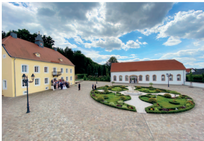
Auf die Hochzeiten am Gut Königsbruch, hier Anfang Juli 2022, ist der Blick aus dem Büro besonders gut und zeigt die ganze Schönheit des Innenhofes.