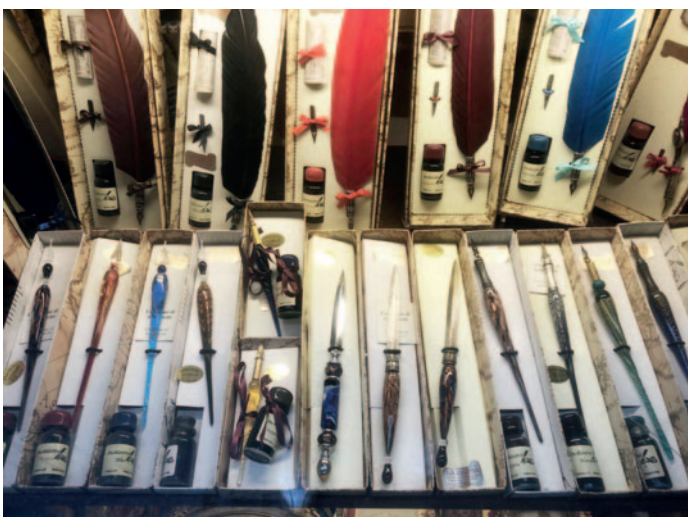
Irene Özbek fotografierte diese schönen Schreibfedersets mit Federn aus Murano-Glas und Metall in einem Schaufenster in Venedig.

Der Mitgliedsbeitrag beträgt im Kalenderjahr 30 €, für Studenten und Azubis 15 €, Schüler sind von der Mitgliedsgebühr befreit. Darüber hinaus können jederzeit weitere Spenden gemacht werden. Den Antrag zur Mitgliedschaft (PDF-Formular) finden Sie auf unserer Webseite.