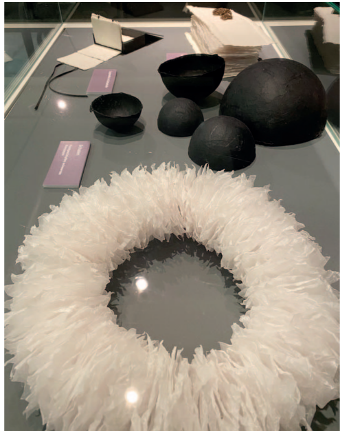
Blick in eine Ausstellungsvitrine auf Papierobjekte von Edda Börner.

faszinierende Persönlichkeit, die durch ihr Wissen, ihre offene Art und ihren unermüdlichen Arbeitseinsatz Begeisterung für Papier und Buch weckte und nicht zuletzt auch Sascha Boßlet dazu bewegte, sich Papier und Buch in all ihren Facetten beruflich zu widmen.